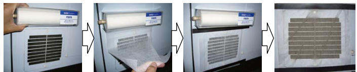
ワンタッチで簡単取付け フィルターを引き出し 付属のマグネットで固定 汚れたら切り取るだけ