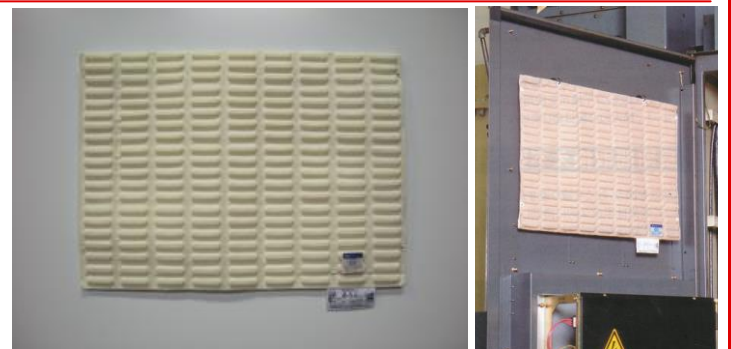
制御盤用除湿シート あうん

電源の入り切りが多く寒暖を繰り返す制御盤内は結露が起こりやすく、回路でショートを起こしたり、長期間結露を繰り返すうち基板表面が腐食し故障を招きます。制御盤用除湿シート「あうん」は、貼り付けるだけで制御盤内の湿度を調整し結露による故障を減らします。本製品は二酸化ケイ素を主成分とするB級シリカゲルを使用しており湿気を吸う・吐くを繰り返すので長く安全にご使用頂けます。安定した設備稼働にぜひご検討ください!