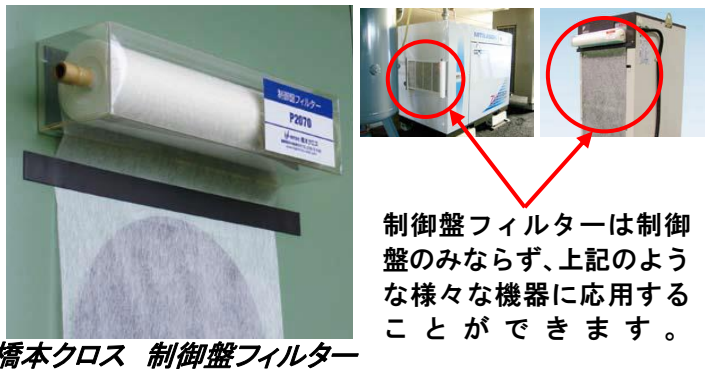
制御盤フィルターは制御盤のみならず、上記のような様々な機器に応用することができます。

制御盤へのオイルミストや粉塵混入は機器の故障を招きますが、混入防止のフィルター交換は非常に手間が掛かります。橋本フィルタの制御盤フィルターは本体裏面がマグネットになっておりワンタッチで取り付けられる上、フィルターにはミシン目が付いているので汚れたらフィルターを切り取るだけで簡単に交換できます。ホルダーにはペットボトルを再利用した素材を使用しており環境にも優しい、制御盤フィルタを一度ご検討ください!